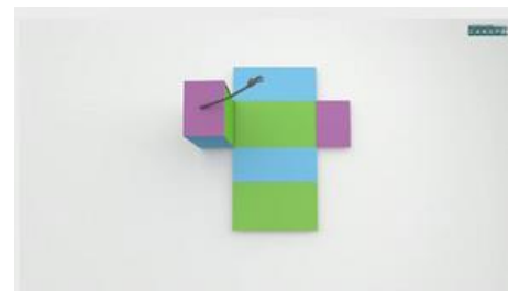
Tracer un patron de pavé droit