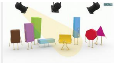
Reconnaître le pavé droit