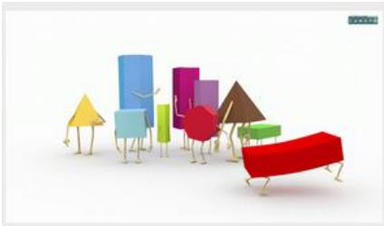
Distinguer prisme et pyramide