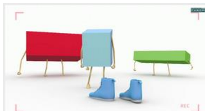
Décrire le pavé droit